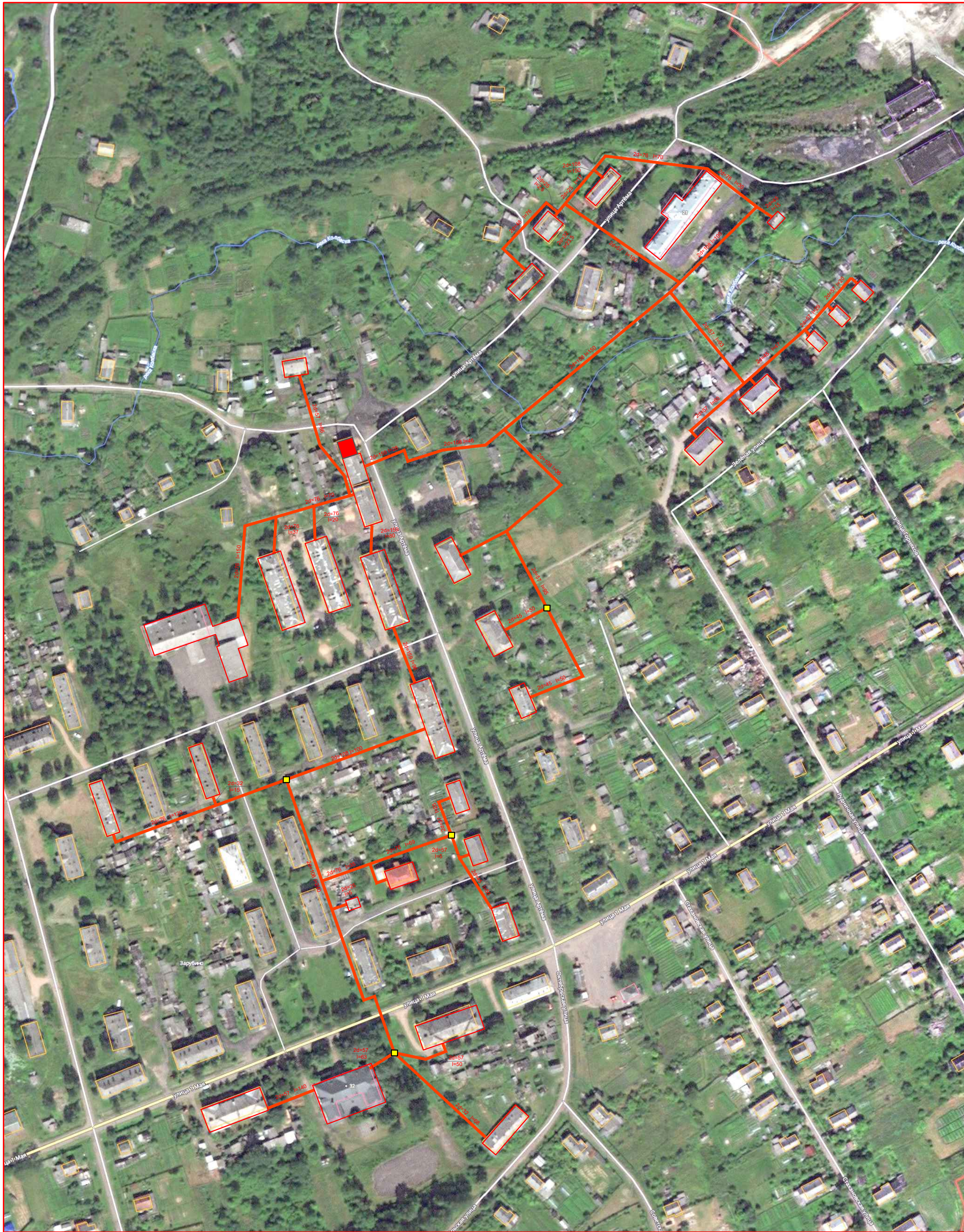
Схема теплоснабжения с. Зарубино от котельной 1,96 МВт фрагмент территории