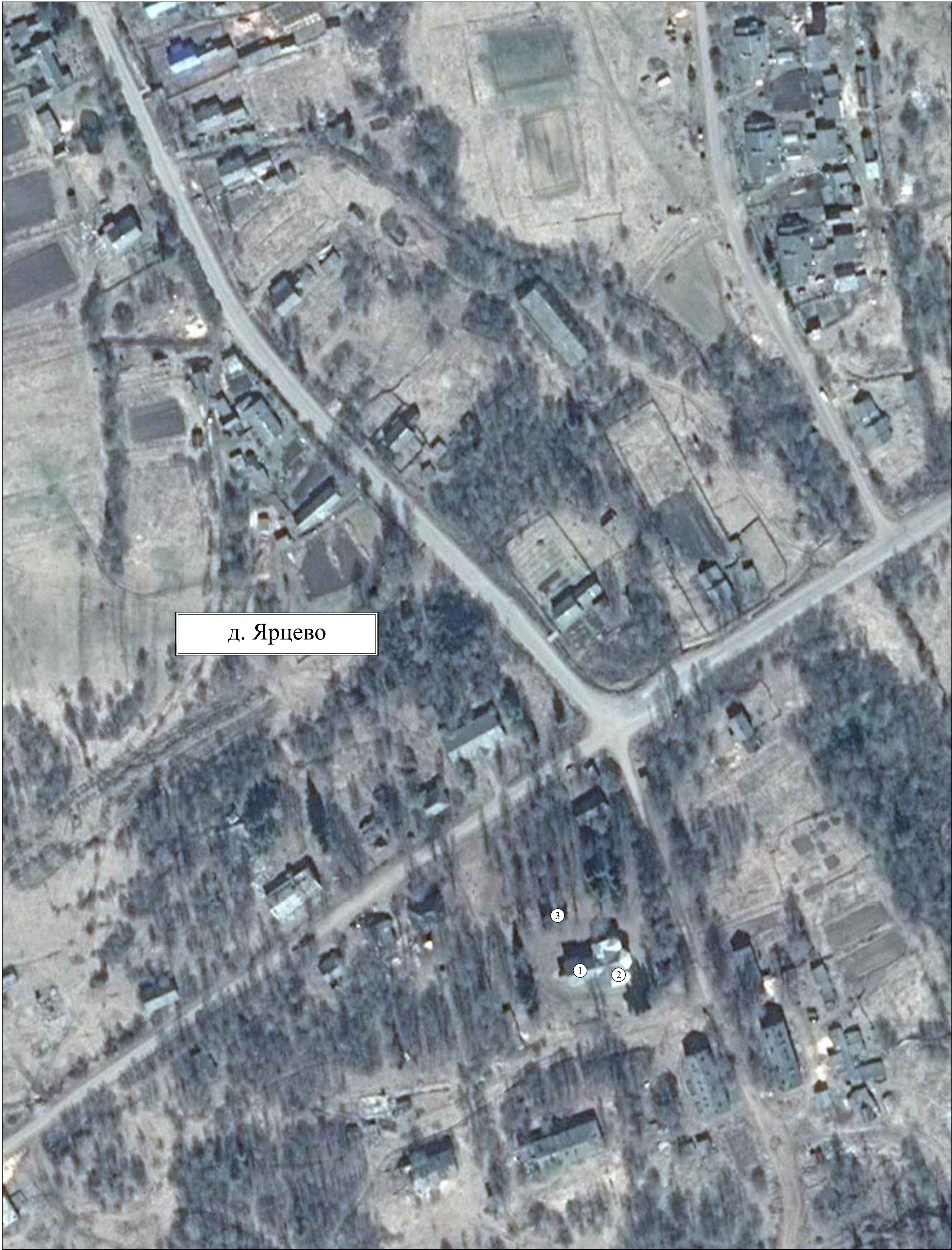
Схема размещения объектов социальной инфраструктуры д. Ярцево